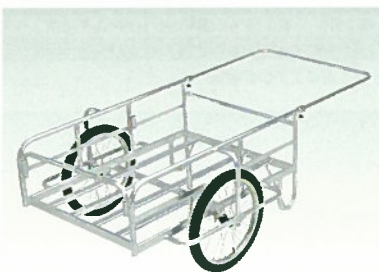
■アルミ製リヤカー AR-50