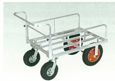
■アルミ製四輪カート UO-01